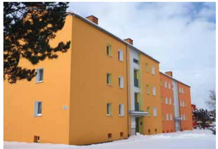
Pinzigweg 45, 47