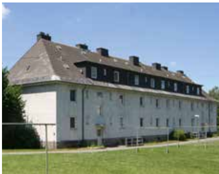
Abbruch der Johann-Weiß-Straße 14, 16, 18

Die ersten Maßnahmen im Rahmen des Städtebauförderungsprogrammes „Stadtumbau West“ in unserem Wohngebiet an der Johann-Weiß-Straße wurden bereits abgeschlossen. In den Jahren 2011