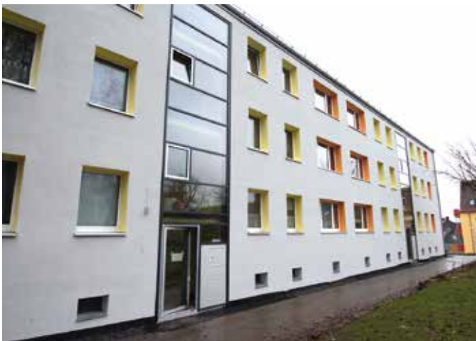
Enoch-Widman-Straße 53, 55

Im Anschluss an den Bericht des Vorstandes brachten die Mitglieder ihre Wünsche und Anliegen vor. Soweit möglich, werden diese gerne berücksichtigt und umgesetzt.