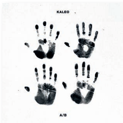
Kaleo, A/B, Audio CD, Atlantic Warner, 10,99 Euro.

Jenseits des Mainstreams überzeugt die Gruppe Kaleo mit ihren mitreißenden Songs. Ob vorwärtstreibender Rock, Blues, Balladen oder Folk, die Fans sind begeistert von dem einfallsreichen Sound. Authentisch und frisch macht sich hier eine isländische Band auf, neue Gefilde zu erobern. Mal rau und sperrig, dann wieder lässig und einfühlsam: Halt so, wie Island selbst. Besonders die Stimme von Jökull Júlíusson überzeugt die rasant wachsende Fangemeinde. Handgemachte Musik at its best. Kein Wunder, dass sich auch zahlreiche Filmproduzenten auf die Musik stürzten und einzelne Songs als Filmmusik einkauf- ten. ●