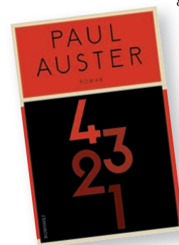
Paul Auster, 4 3 2 1, Rowohlt Verlag, 29,95 Euro.

Ein Leben kann ganz unterschiedlich verlaufen. Das sagt sich Archibald Ferguson, der in den Fünfzigerjahren in Newark aufwächst. Wie sie sein könnten, diese anderen Leben, das fächert das opulente Meisterwerk Austers mit all seinen Konsequenzen auf. Da gibt es das provinzielle, bescheidene und enge Leben, die kämpferische Variante, ein Leben als Spielball der Ereignisse oder eine Existenz als künstlerisches Genie. Was das neben all den Klischees wirklich bedeutet, zeigt dieses erzählerische Was-wäre-wenn-Glasperlen- spiel mit ungeheurer Wucht. Mit seiner literarischen Eleganz hält Auster für seine Leser auch so manchen dramatischen Salto bereit. Letztlich geht es um die Frage, die auch wir uns im Leben immer wieder mal stellen: Na, wo soll es hingehen, mein Freund? ●