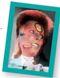
Mick Rock, The Rise of David Bowie, 1972–1973, Taschen Verlag, 59,99 Euro.

Als einer der Ersten schlüpfte David Bowie Anfang der Siebziger in die Rolle einer Kunstfigur: Ziggy Stardust. Seine Auftritte als androgyne Glamour-Ikone wurden über Nacht zum Kult und toppten mit aufwendigen Bühnenbildern und Kostümen alles, was bisher in dieser Richtung versucht worden war. Mit immer neuen, teils bizarren, teil modeprägenden Outfits schockte und begeisterte er die Öffentlichkeit. Mit 25 Platten und 140 Millionen verkauften Tonträgern gilt er als einer der einflussreichsten Musiker der jüngeren Musikgeschichte. Begleitet wurde er während dieser Zeit vom Fotografen Mick Rock. Seine Fotos sind jetzt in einem fulminanten Bildband erschienen. Er katapultiert die Betrachter zurück in die Stimmung einer künstlerischen Gründerzeit, in der sich der Rock neu erfand. ●